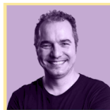
MARCOS PUEYRREDON MARKETING PARA E-COMMERCE VTEX